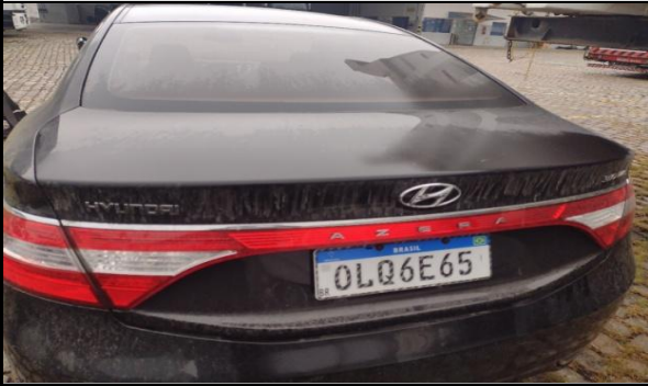
CHAVE DE RODA