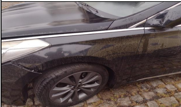
PARALAMA DIANTEIRO ESQUERDO