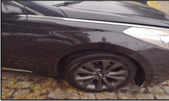
PARALAMA DIANTEIRA DIREITA