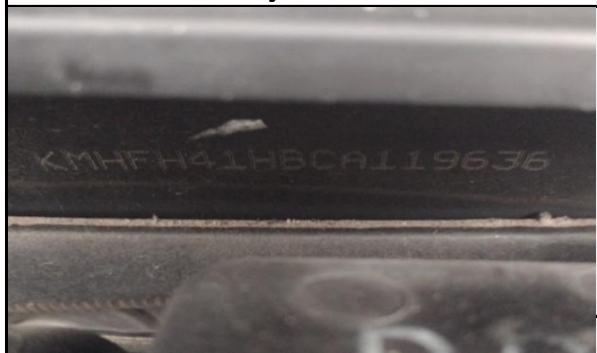
NUMERAÇÃO DO CHASSI