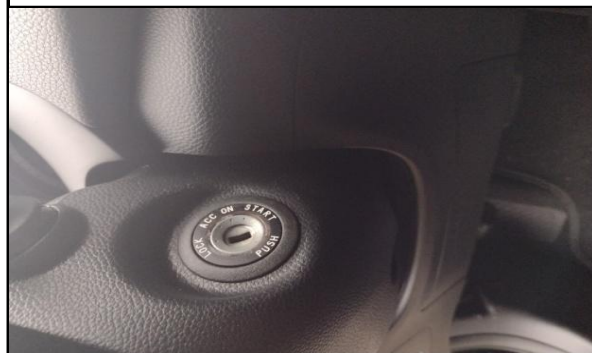
TIPO DE CHAVE