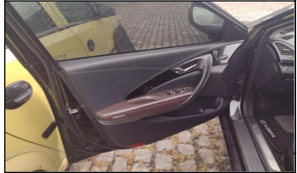
REVESTIMENTO INTERNO LATERAIS