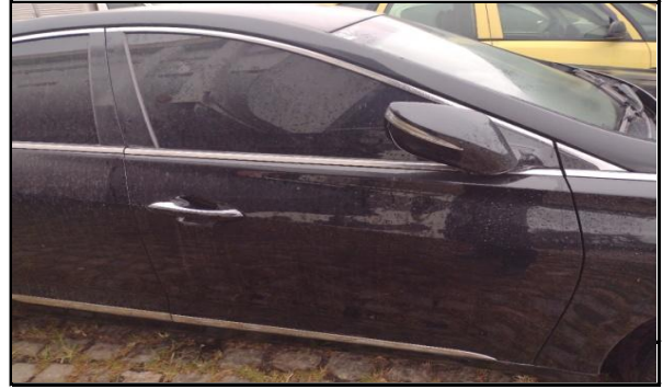
PORTA DIANTEIRA DIREITA