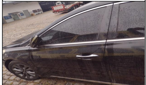
PORTA DIANTEIRA ESQUERDA