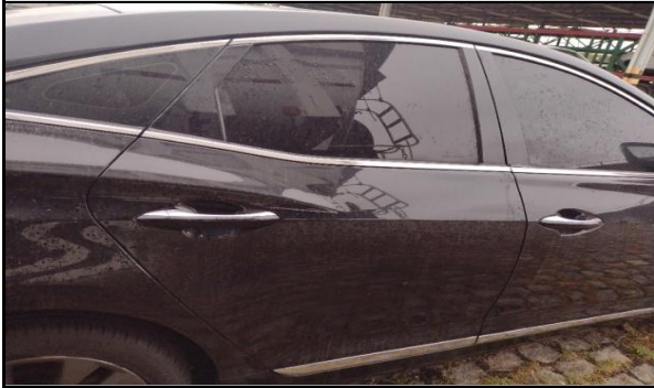
PORTA TRASEIRA DIREITA